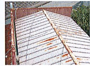
小屋のトタン屋根が錆びて 来ているぞ、