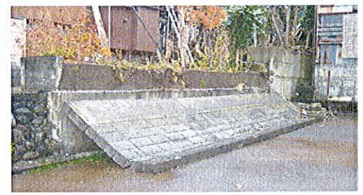
ブロック塀も倒れてしまった、このまま では駄目だし、急がないと、