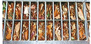
溝が詰って掃除するにも 蓋が重くて思う様に出来ないし、