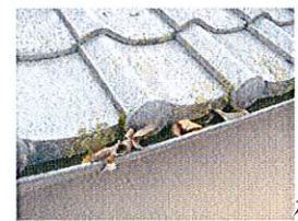
樋の詰りは解っても 古くなって歪んでるし 部分的に取替えとか 出来るかなあ、