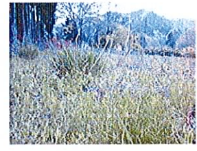
空き地だが草が、 何とか成らないかなあ